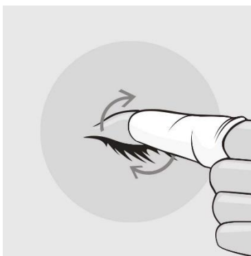
Фигура 2: Почистване на клепачите и миглите.

Нежно масажирайте клепача с помощта на леки кръгови движения, отстранявайки всички остатъци от засъхнали корички, секрети или грим.